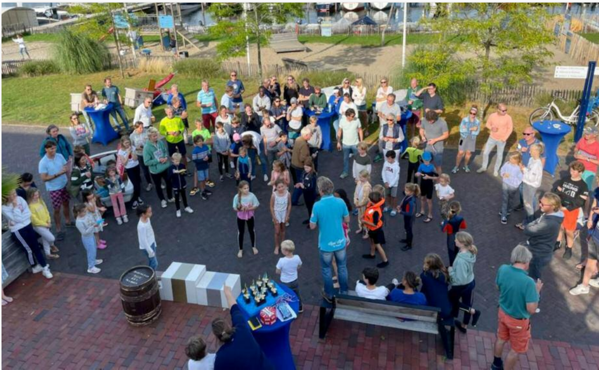
Prijsuitreiking Harington 2021

Als je geen zeilende (klein)kinderen hebt, kom dan gerust op een mooie zondagmiddag even langs en meegenieten. Het clubhuis is dan ook open en met een lekker zonnetje is het heerlijk vertoeven op het terras!