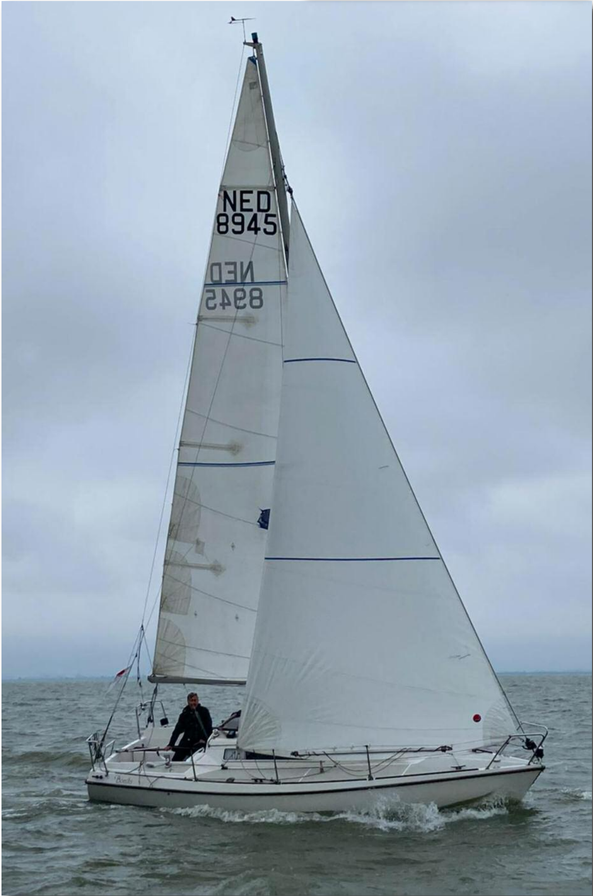
Dick de Kruijk met zijn Orion, een Bonita 767