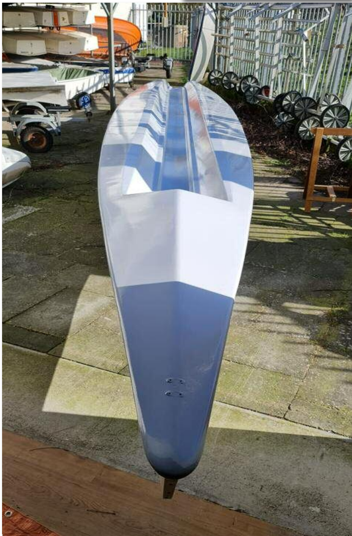
De kale Kano van de vereniging.