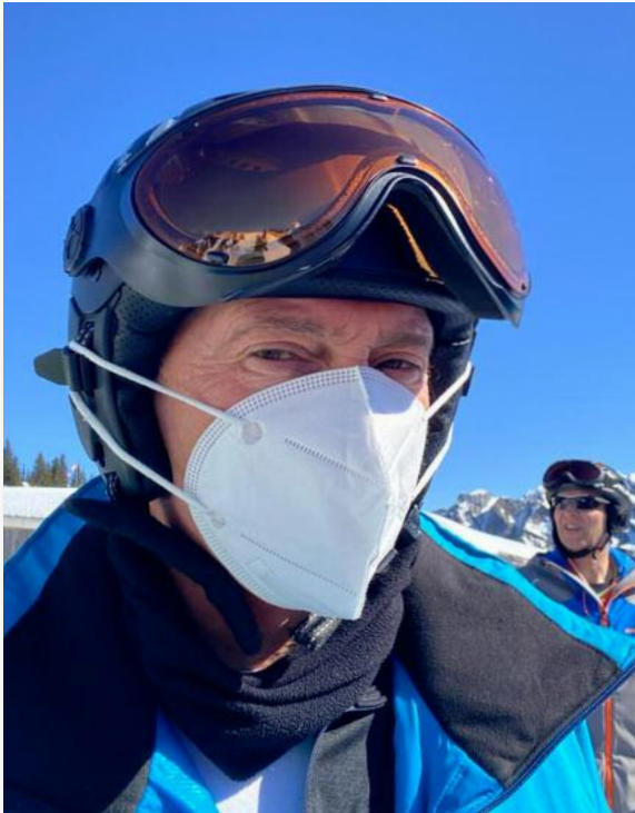
FFP2 op de piste.

moeten ze daar blijkbaar nog een week op wachten. Hier hebben ze dan zo'n FFP2 masker; net een muilkorfje.