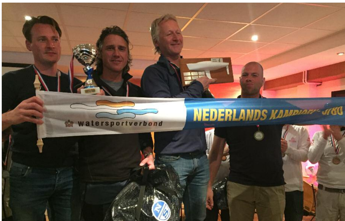
Jorrit Bergsma met zijn bemanning doet ook weer een gooi naar het ONK.