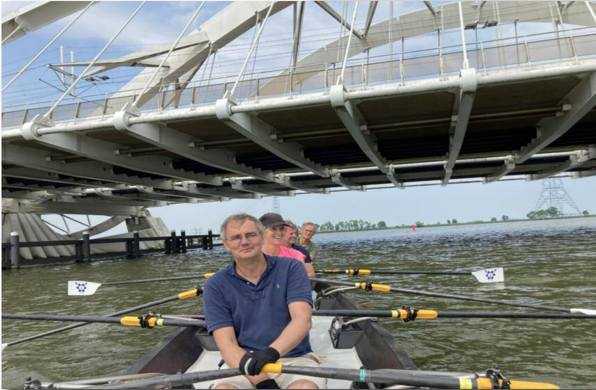
Onder de karaktestieke BH-brug bij IJburg door.

hekken en nep gravel. Nee, IJburg leek mij niet heel pittoresk om doorheen te roeien. Maar het besluit was genomen en met goede moed gingen we aan de tocht beginnen. Eerst naar Pampus, om na een heerlijk stuk roeien in de zon een kopje koffie te drinken. Het aanleggen ging als een zonnetje, weinig golven en zoals het op het water gaat een helpende hand om uit te stappen. Ja beste zeilers, onze Swifts zijn prachtig maar de steigers liggen gemiddeld gezien wat hoog voor ons.