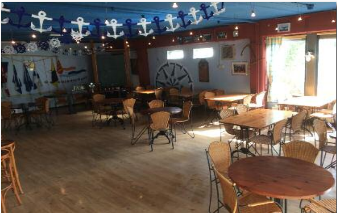
het 'Behouden Huys' van voor 2017.