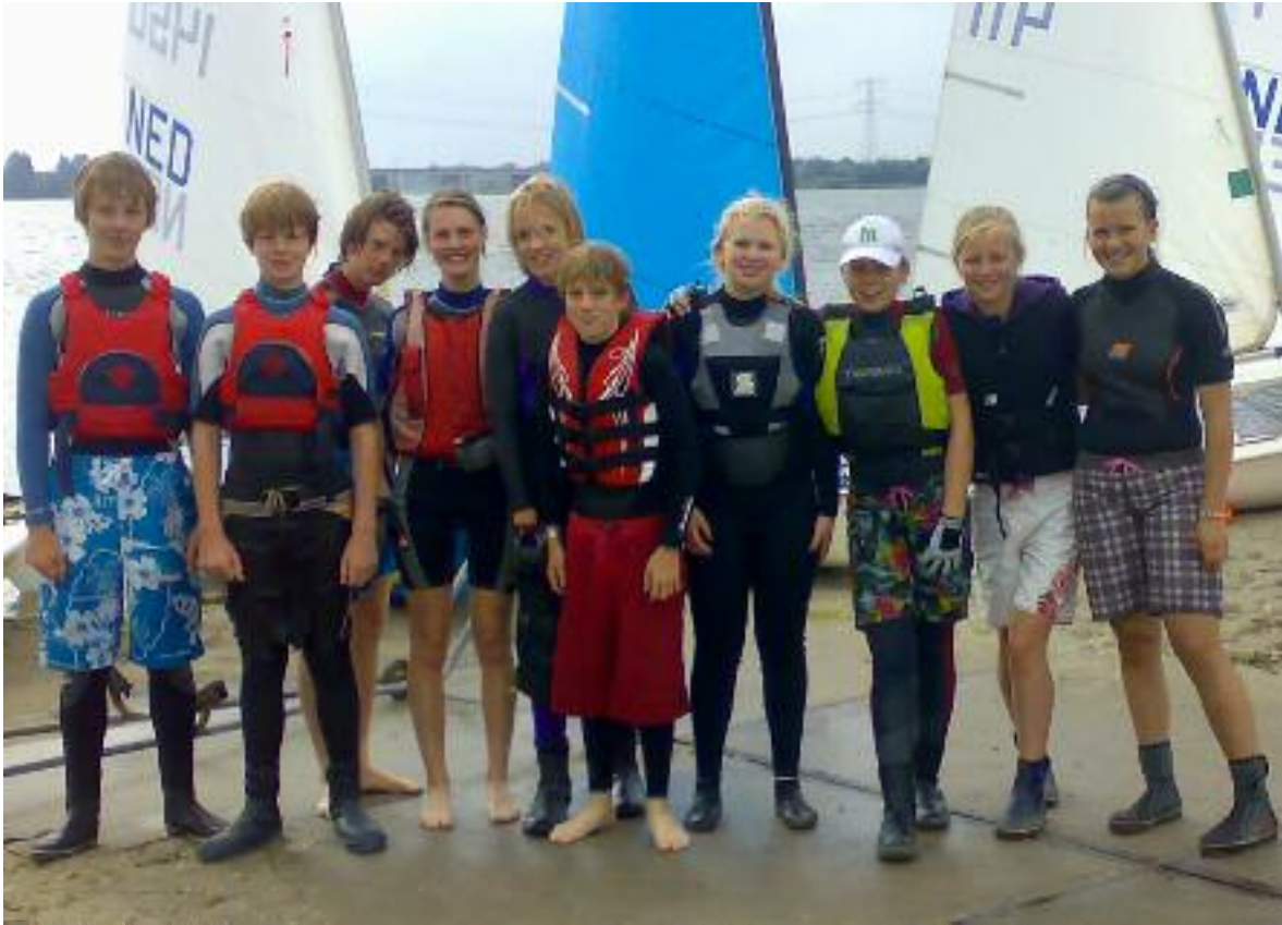
Zwaardboten 2007, op het strand van Muiderzand.

Eshuis jr. De doelstellingen en voorwaarden werden duidelijk opgeschreven en benadrukt werd dat we geenszins een zeilschool wilden zijn. Desalniettemin werd een flinke professionalisering doorgevoerd. Er werd een jeugdzeilweekend aan het programma toegevoegd, er werd fanatiek wedstrijd gezeild, onder meer met 5 Vauriens (2mans boten). Daarnaast werd een 'bengel' groep toegevoegd omdat er steeds meer interesse kwam om jeugdzeilen te geven aan kinderen jonger dan 9 jaar en we werden CWO erkend. In 1994 werd