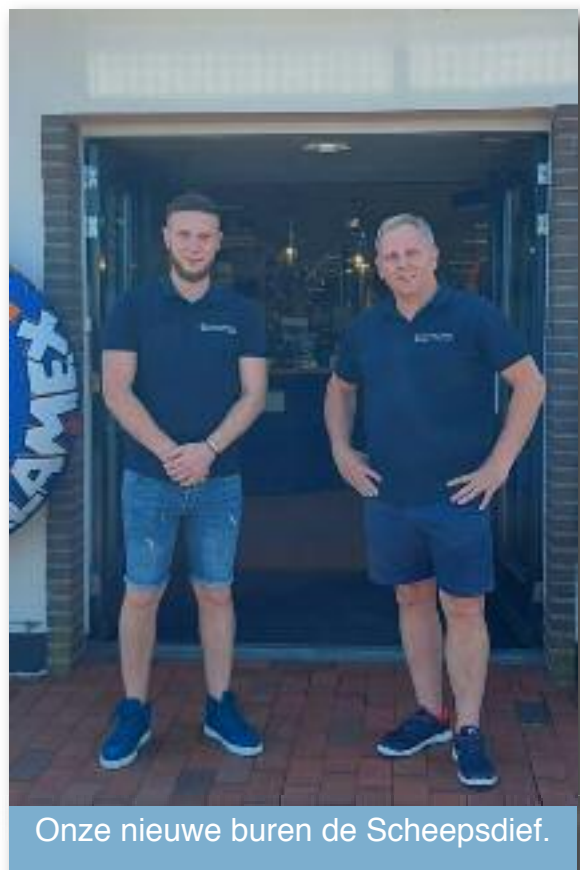
Onze nieuwe burens de Scheepsdief.

* Oud(ere) leden. Attendeer vooral oudere leden op het lustrum-weekend, ook als ze niet meer lid zijn. Hoe meer zielen hoe meer vreugde! en toch leuk een reünie met je oude zeil en roei maatjes?