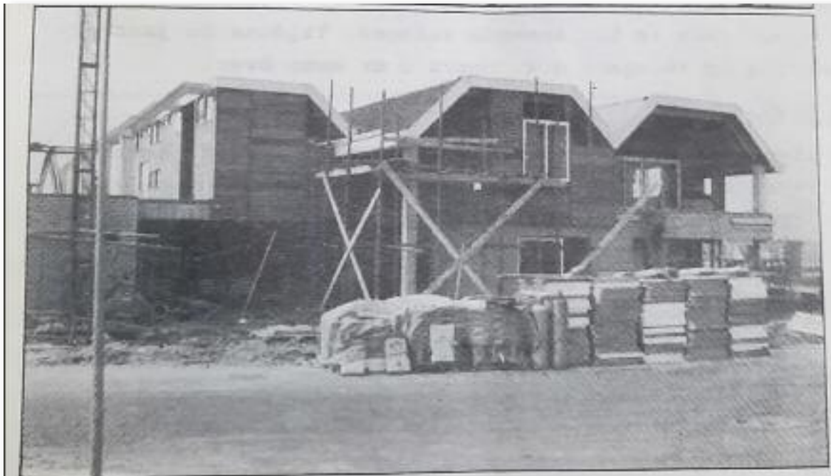
De haven van Naarden: 1 april is alles klaar om de schepen te ontvangen!