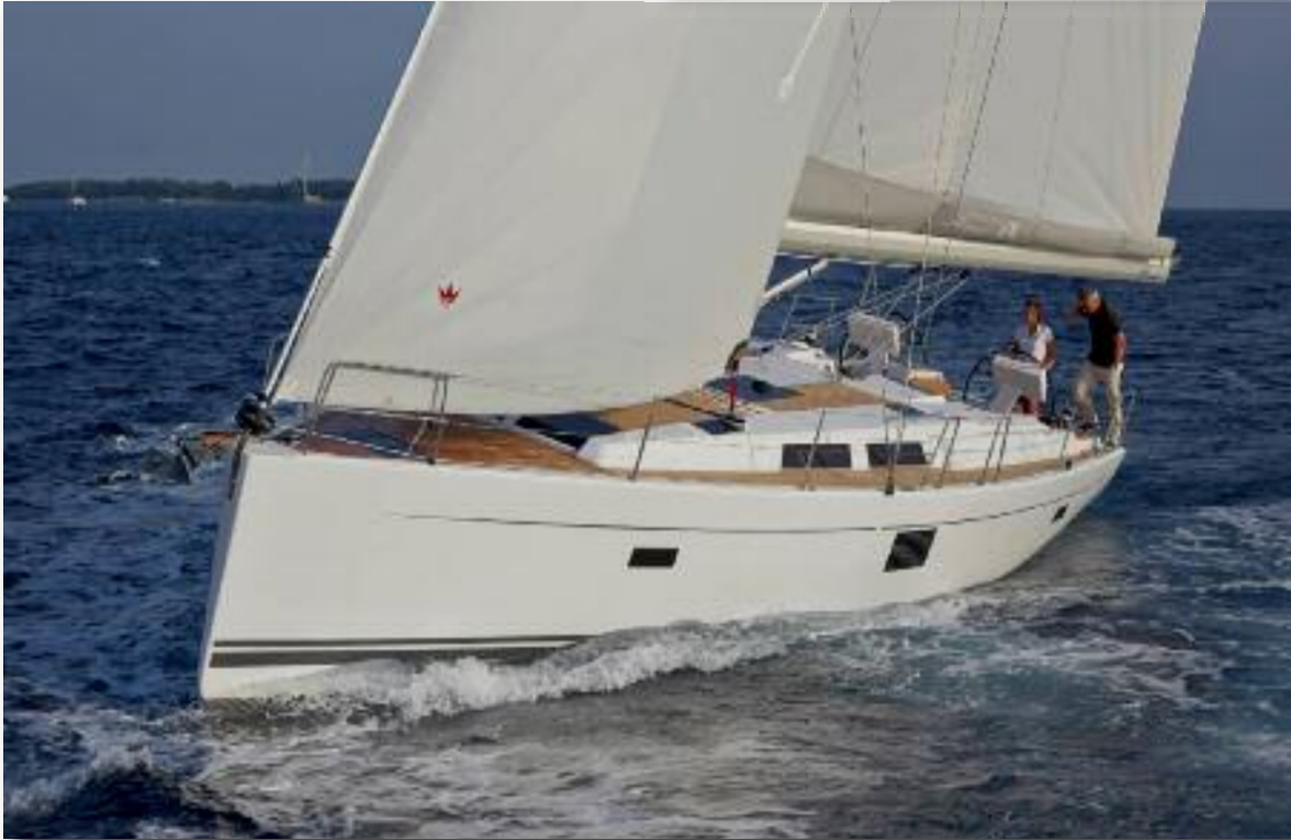
De vette Hanse 455 onder zeil.

aan de kade want de dames willen vanavond shoppen. Onze burens van vandaag zijn een gepensioneerd Italiaans stel. Die zijn lekker samen 4 maanden op pad met een “vette” Hanse 455.