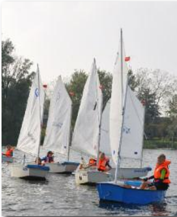
De Bengels in hun Optimisten.

de 40 en 50. Vaak 2 beginners groepen en zo'n 4 meer ervaren groepen optimist zeilers. Ook de