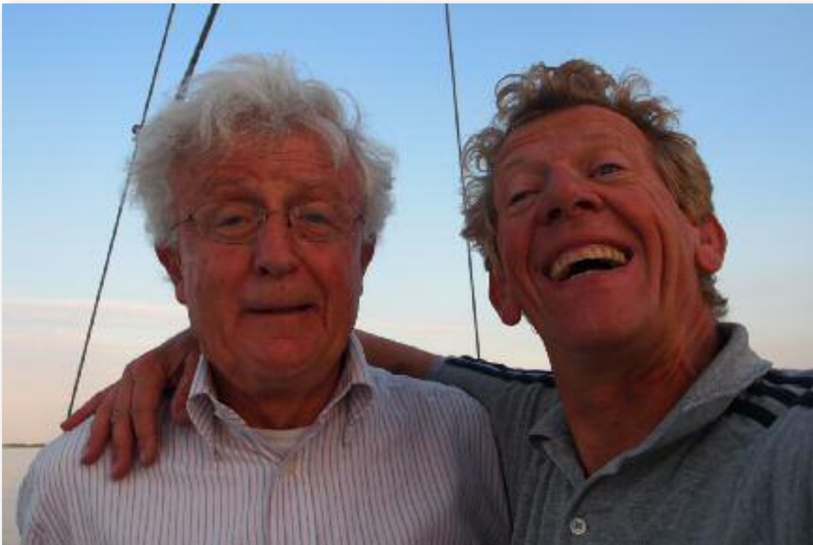
De Ereleden van de R&ZV Naarden.

IJsselmeer. Ook werd jarenlang de ludieke Hekkesluiswedstrijd georganiseerd aan het eind van het wedstrijdseizoen, waarbij het de bedoeling was om als laatste te finishen – dan had je het langste zeilseizoen – en dat werd nagestreefd door creatieve capriolen uit te halen, zoals een heel rak achteruit zeilen en veelvuldig toiletbezoek tot op de finishlijn en veel wapperende zeilen. Bij de toertochten die georganiseerd werden, bijvoorbeeld naar Volendam, Hoorn, Enkhuizen of Lelystad, waar dan de Batavia ook werd bezocht, gingen echtgenoten en partners ook graag mee.