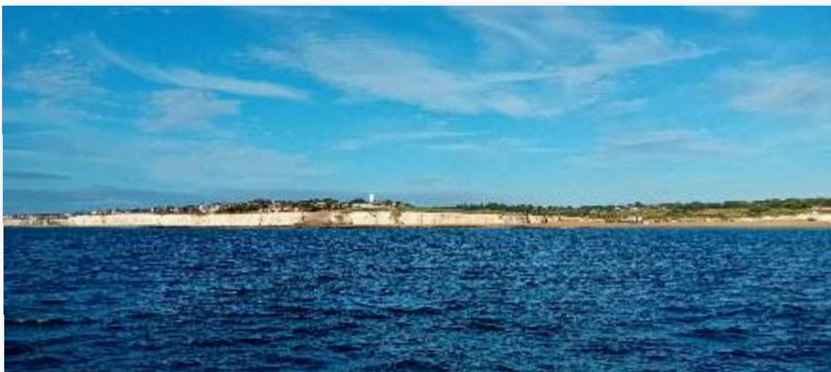
Margate ook Albino.

Dinsdag een lekker tochtje naar Oostende, alwaar ik de Tir na nog parkeerde bij de “Royal Yaught Club Oostende” om bij herhaling te horen: “ben je met dat bootje naar Engeland gevaren? Zo....” Voordeel van een klein bootje is dat zij tussen twee grote past: