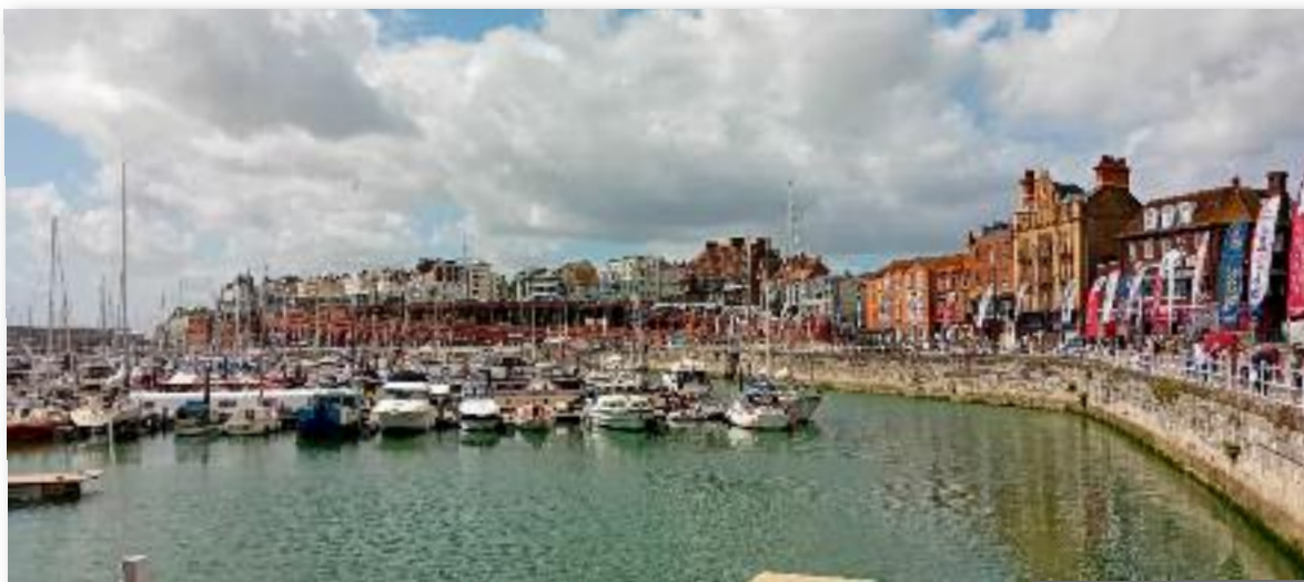
Enmaal binnen is de rust weder in Ramsgate.

Na een tocht van ruim 10 uur en 42 mijl met het laatste stuk wind en stroom tegen om 16:00 (UTC) aangekomen in Queenborough voor de eerste mooring ervaring. Het lukte om heel behoedzaam en rustig varende in een keer de mooring te pakken te krijgen en aan te meren. De bijboot opgeblazen en de motor er aan gehangen en op naar het welverdiende pubfood van de plaatselijke kroeg.