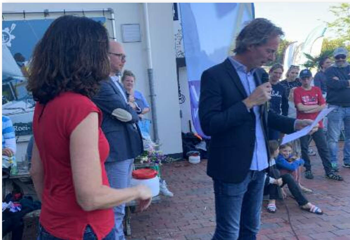
De Voorzitter met de nieuwe mobiele audio.