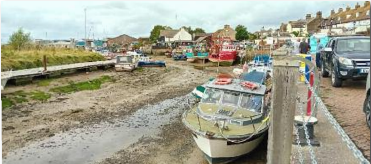
Queenborough zonder water is geen optie voor een Waarschip.

Als je solo zeilt app je wel eens, maar op de Medway is dit af te raden, want op een bepaald moment keek ik op de plotter en zag dat het water verdwenen was en alles groen was geworden. Snel uitgezoomd en terug naar het blauwe.... Goed opletten op de Medway. Knap dat die vloot onder leiding van De Ruijter in 1667 zo