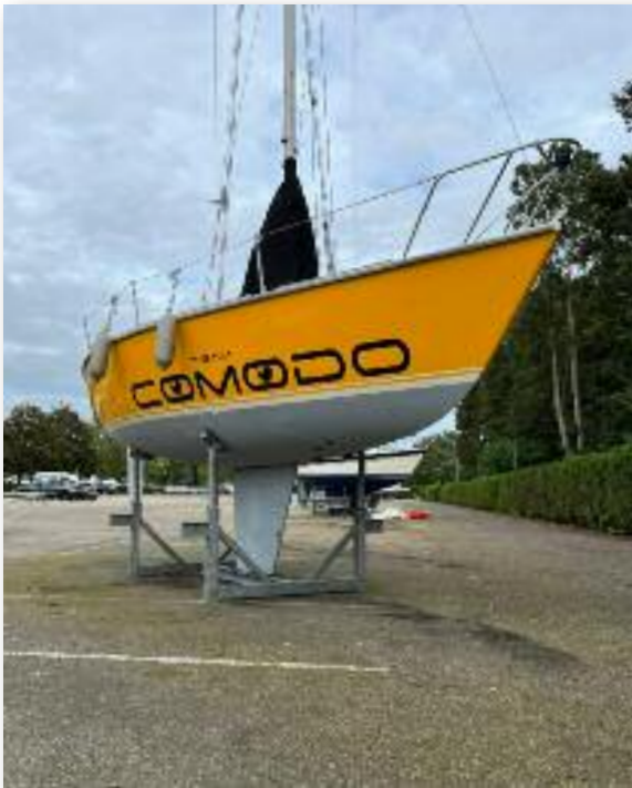
De Comodo op de kant, hoog en droog.