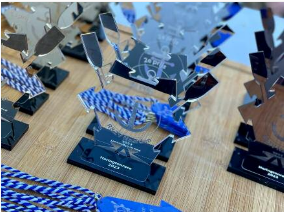
De Haringtonrace prijzen 2023.