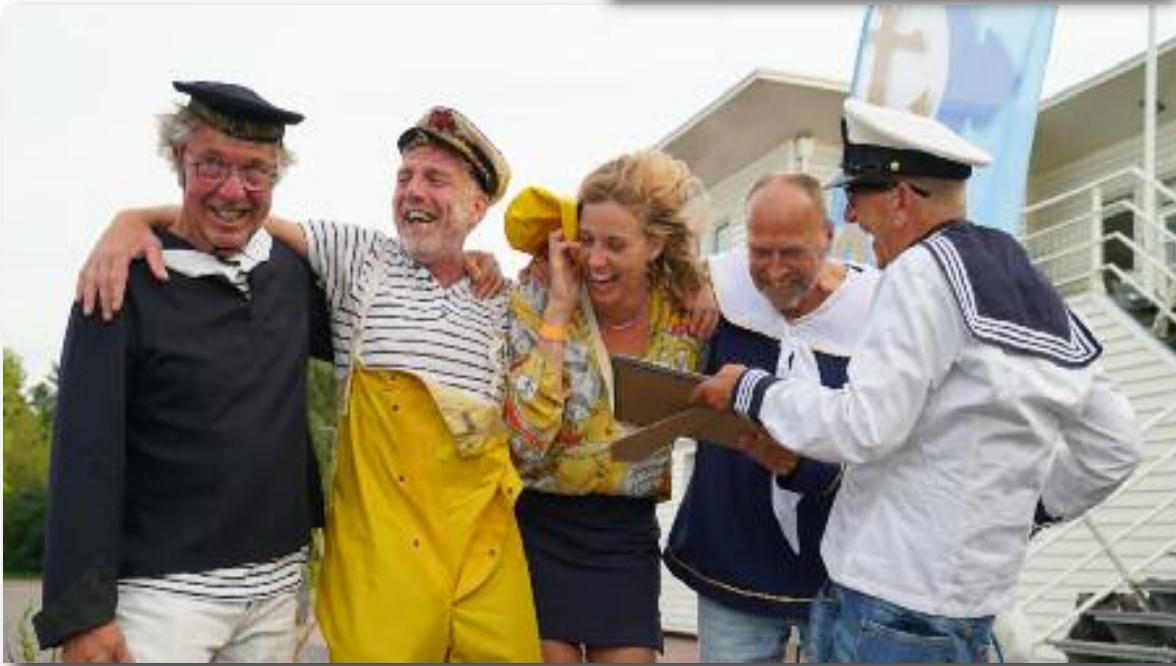
Ter herinnering aan de grote oversteek, de Oorkondes uitreiking.

Een rode broek zou gecertificeerd kunnen worden, de rode broek krijgt dan een certificaat in de vorm van een opstrijkbaar union jack badge.