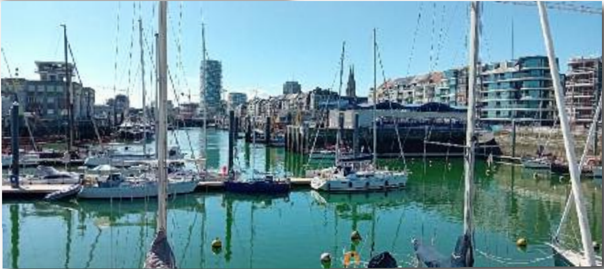
Bij de RNSYC jachthaven in Oostende.

Na een welverdiende rustdag verder gevaren naar Cadzand alwaar ik een bezoekje aan Sergio Herman wilde brengen in Cadzand-bad, maar hij was niet thuis. Blijkt dat hij gaat stoppen met het restaurant, dat al maanden van tevoren is gereserveerd. Oud Sluis blijft geopend, maar op de website las ik dat hij een avontuur in de Oost aangaat, waar men hem nog niet kent, in samen-