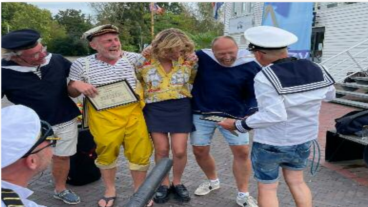
Voor de wind, water en golven beleving. De bladblazer, de zoutwater sproeier, en de erkenning dat jullie een leeuwenhart hebben.

Dit jaar hebben een aantal boten een poging gewaagd deze pittige reis te ondernemen, echter de omstandigheden maakten dat niet iedere boot de reis succesvol had