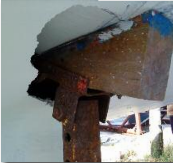
De schade was enorm.

Misschien wil iemand anders volgende keer ook wel een artikeltje voor de Grommer schrijven met iets om te blozen of schandaligs wat hij/zij heeft meegemaakt en waar we wat van kunnen leren of hard om kunnen lachen. Allemaal prima, als de goed bedoelde gratis adviezen maar wegblijven.