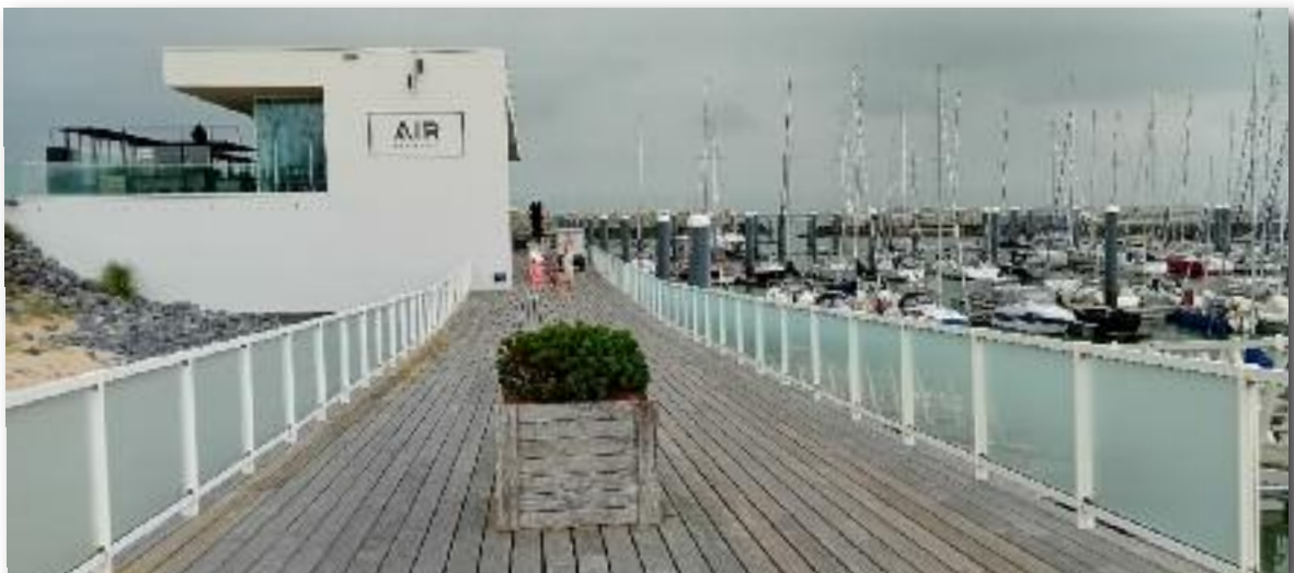
Cadzand, bijna weer thuis.