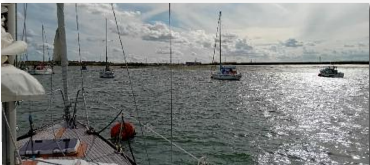
Aan de mooring bij Queenborough.