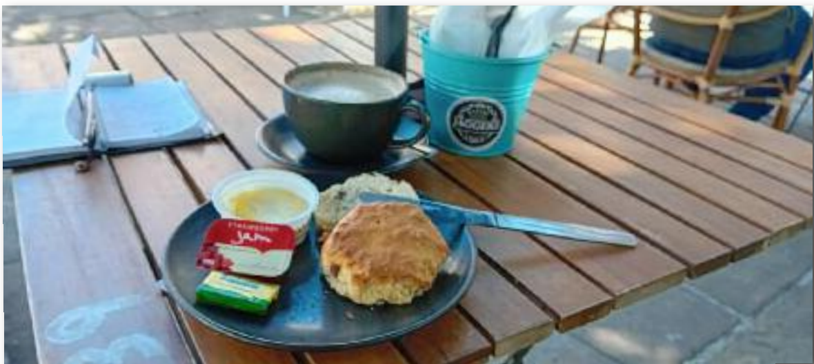
Jammie jammie, scones met roomboter.

Op zaterdag 19 augustus vertrok ik uit Queenborough. Nu niet door het Queens Channel, maar over de Kentish Flats (vlakke bij Kent) Bij LLW staat er rond de 2 meter water,, met opkomend tij steeds 3 tot 4 meter. Ruim voldoende en hiermee verreed ik de hoge golven in de Queens Channel. Langs Margate en Northforeland naar