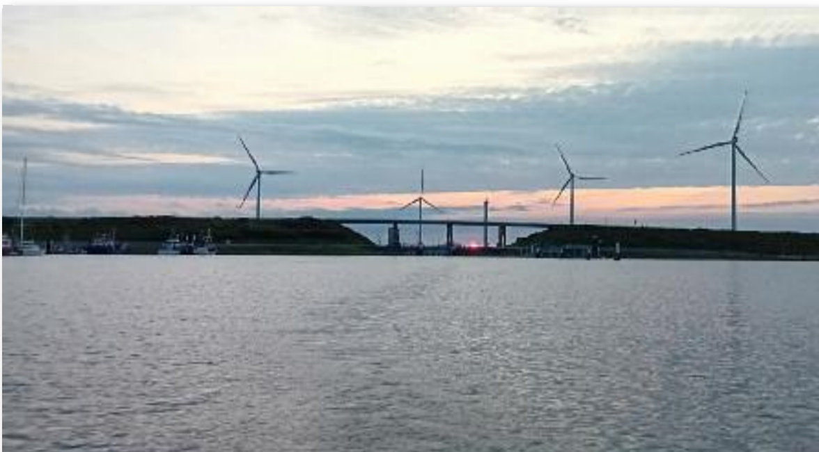
Roompotsluis een slaappleats voor de nacht.