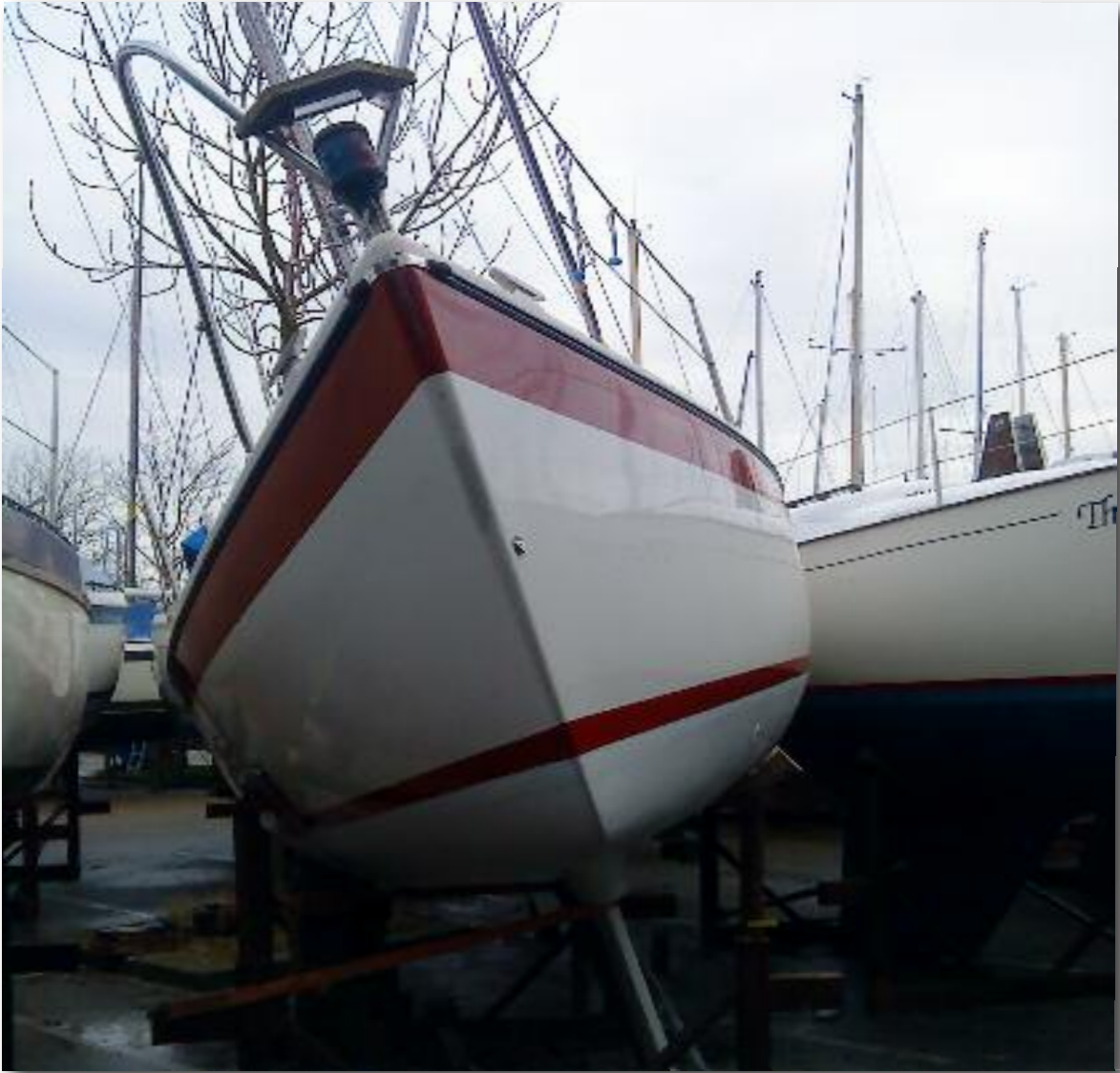
Door een stempeltje gezakt.

pleuris en ik kan je zeggen, dat is nog een understatement. On top of that, waren we vervolgens ook 3 maanden de schande en attractie van de haven, want ja, de boot kon niet weg. Pas toen alle boten weer te water waren, kon de kraan van Schaap komen om de Libertas mee te nemen naar Lelystad. Je kan je vast voorstellen dat het weghalen van stempeltjes niet zo mijn ding is