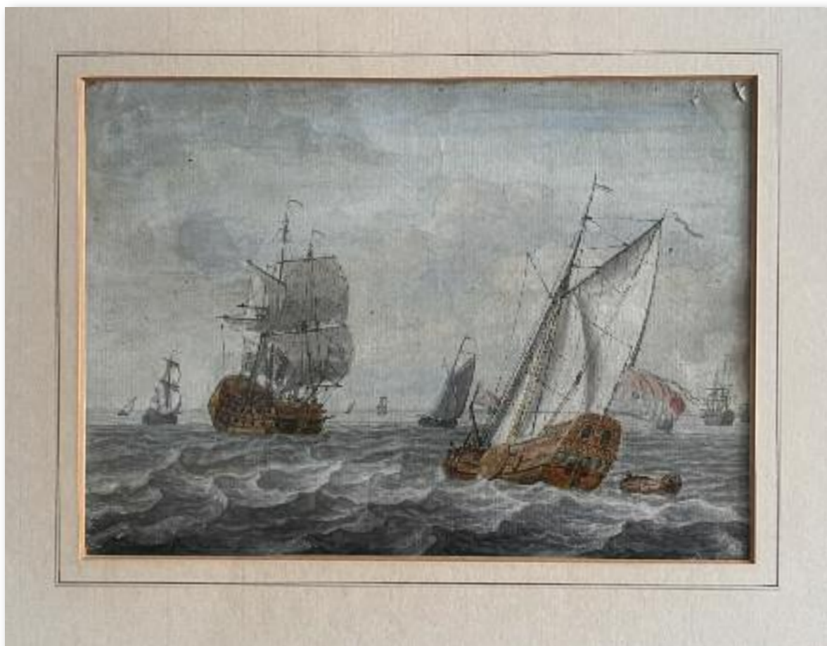
17e Eeuws VOC schip.