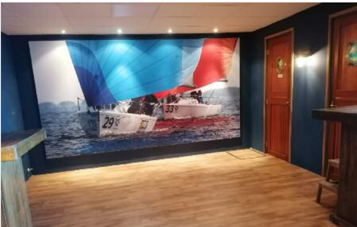
De verplaatste muur met het J/80 spandoek.