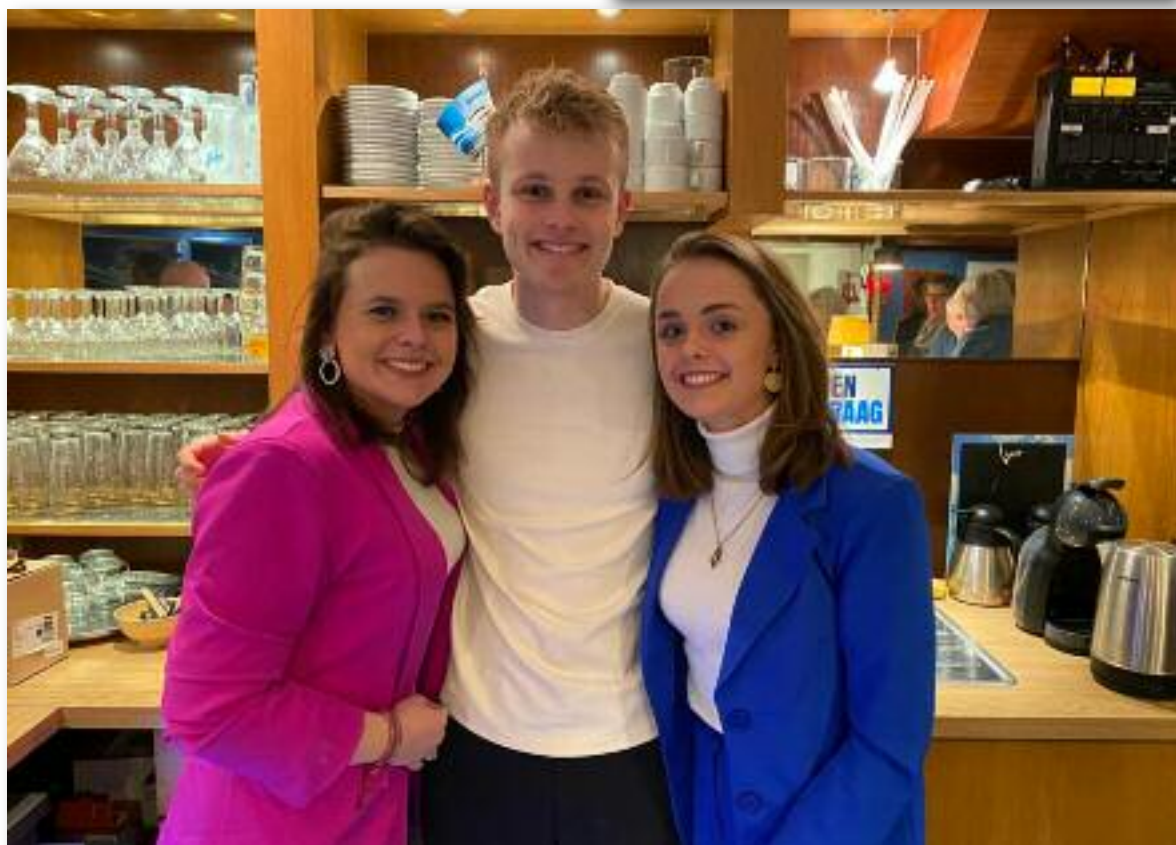
De Vaarkracht vrijwilligers.