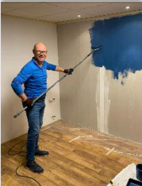
Jurgen de winterschilder van het klusteam