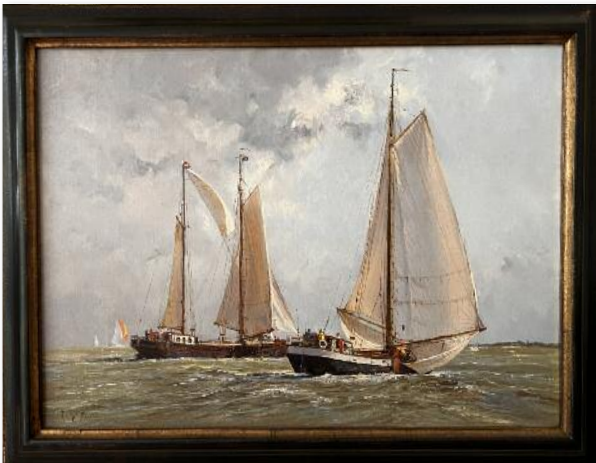
2 Clippers op het IJsselmeer

Zweedse reder waarvan het daadwerkelijke schip in 1835 bij Oostende is vergaan. Toch denkt Eddo dat het uiteindelijk door een Rotterdamse reder is teruggekocht, want hij leest tijdens zijn onderzoek naar het schip dat deze is ingezet als koopvaardij schip naar bestemmingen als Suriname. Via marktplaats heeft Eddo het model gevonden en de plaatjes zien er indrukwekkend uit, helaas blijkt als hij het gekocht heeft, dat er toch met het model is gerommeld en er items ontbreken. De tuigage is prima, echter de dek