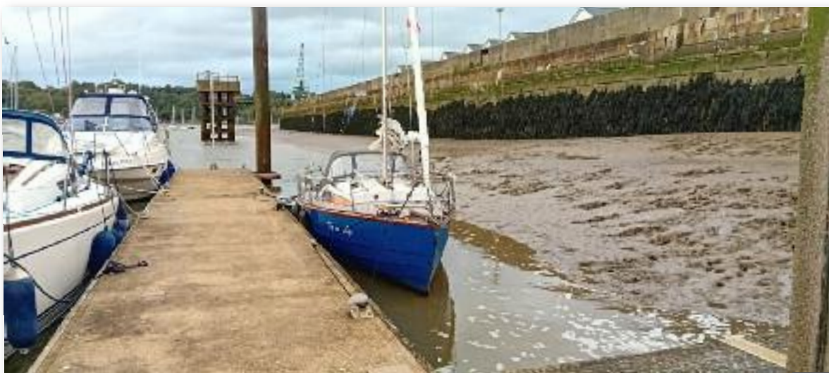
Chatham was er net genoeg water om rechtop te blijven staan.

De komende dagen lekker uitrusten en genieten van de Engelsen en Engeland. Wat een aardige mensen lopen daar op dat eiland rond. Met de bus naar Rochester om het oude centrum te bekijken. Een aantal jaren geleden ben ik in York geweest met dezelfde echt Engelse winkelstraatjes. Heerlijk genieten op een terrasje met uitzicht op de kathedraal en het kasteel met koffie en scones met room, jam en roomboter. Niet echt gezond, maar lekker! Ter compensatie en om