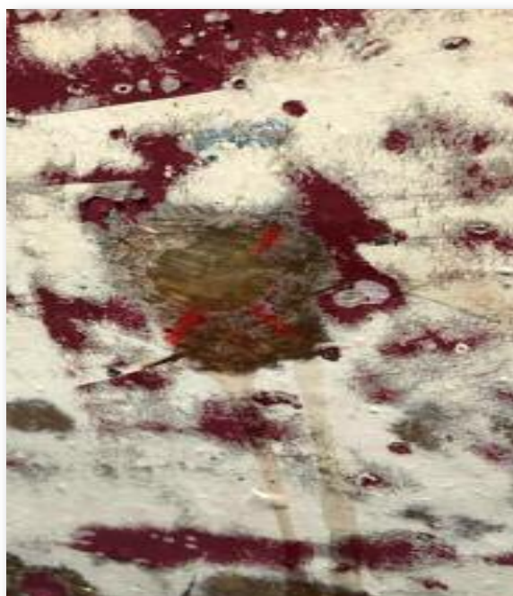
Osmose, het zuur liep eruit.