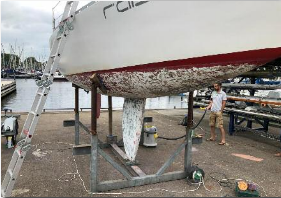
Een erg zure boot, met veel osmose.

de Raissa. Nadat we Comodo 1 (onze Compromis 888) verkochten, kochten we als team een Baron 76. Een mooi, snel bootje – kwarttonner. Na een heerlijke zomer varen, werd het tijd voor een winter opknapbeurt. Een paar osmoseblaasjes open slijpen, drogen en klaar, zou je denken. Maar na 30 cm slijpen kwamen we nog steeds geen stabiele laag tegen. De boot was compleet aan het delamineren. Uiteindelijk werd ons vriendelijk verzocht te stoppen met slijpen, want het zuur spoot in het rond en zorgde voor wat... ongewenste neveneffecten in de haven. Gelukkig was daar