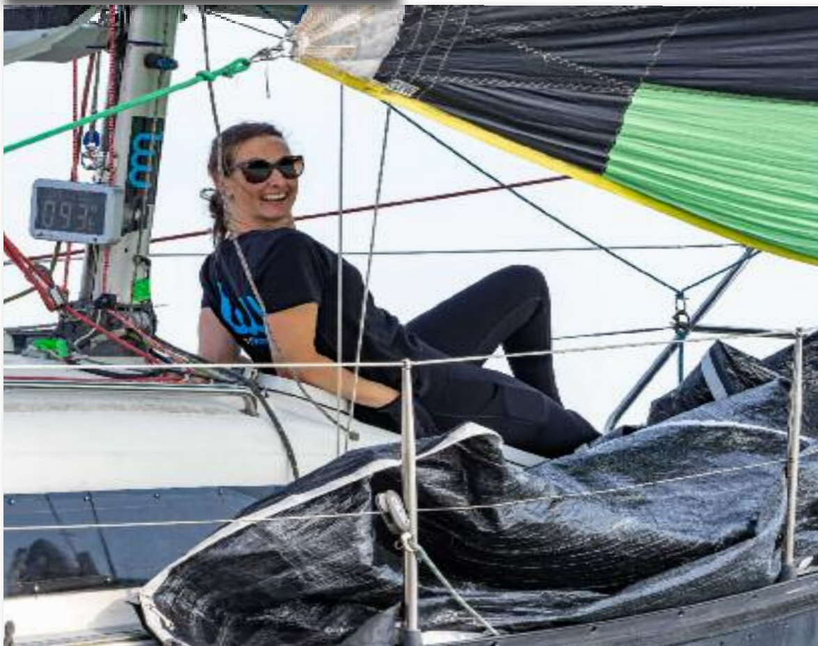
De WAC een topsport.

op teletekstpagina 710 (District Marken). In dat geval volgt berichtgeving via de WhatsApp-groepen RZVN Wedstrijden en RZVN WAC Talk.