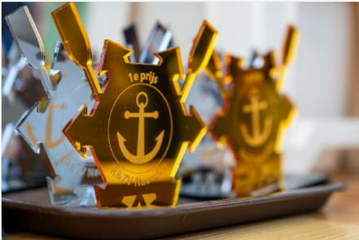
Het edelmetaal waar een seizoen lang om wordt gestreden.

Het nieuwe WAC-seizoen begint op Woensdag 2 april met de traditionele openingsavond. Hylke en Bernard verzorgen een interactieve en leerzame lezing over strategie, tactiek,